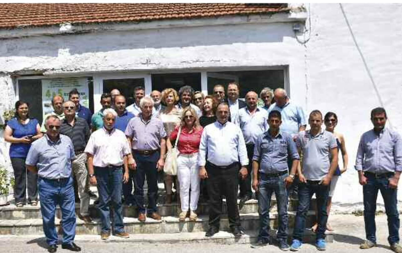
Θεοδώρανα Άρτας 4 & 5 Αυγούστου 2018