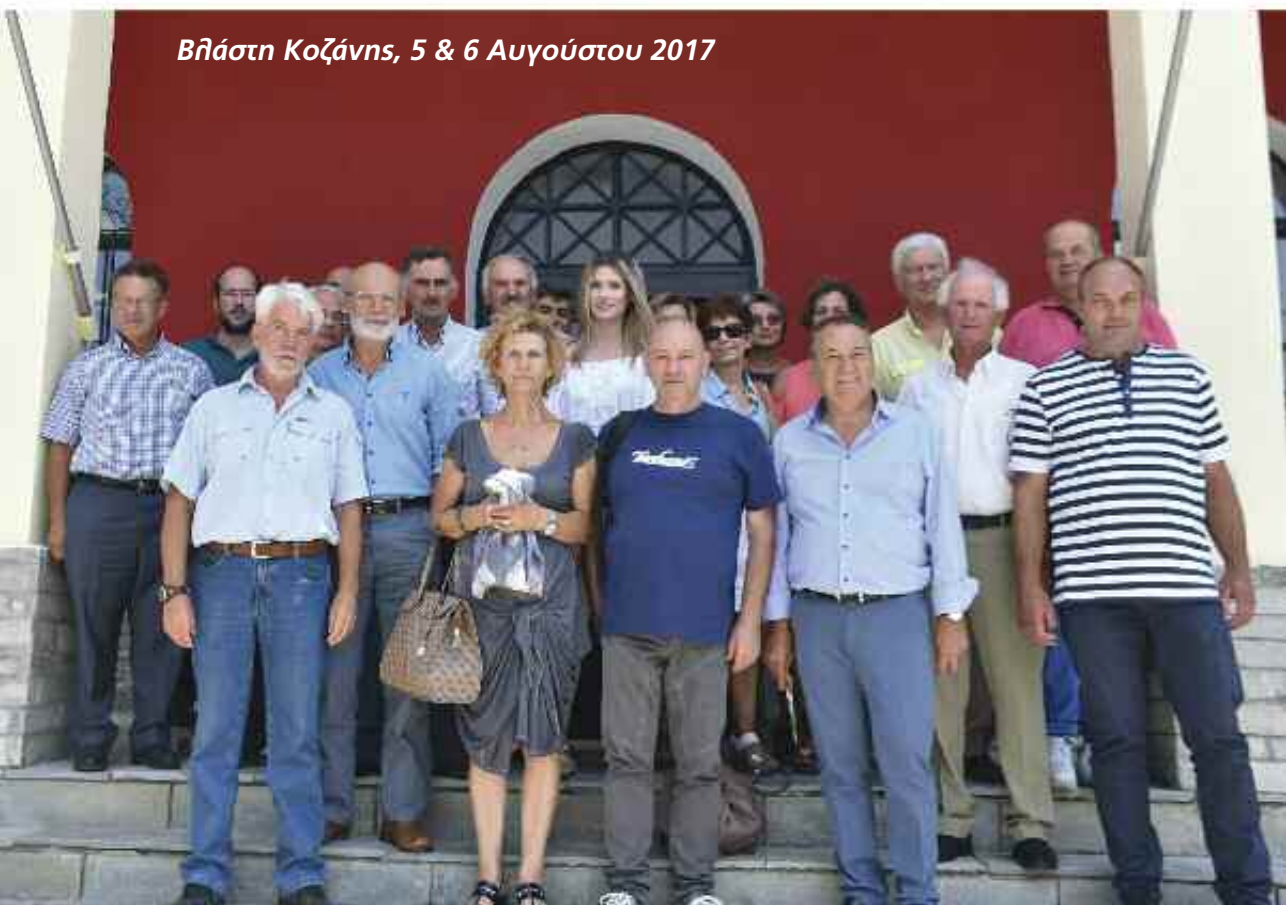
Βλέστη Κοζάνης, 5 & 6 Αυγούστου 2017